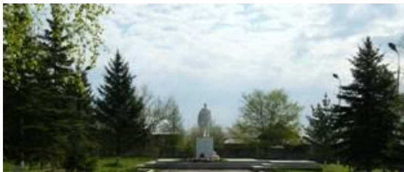
Памятник Мантуровскому Алексею

В границах городского округа город Мантурово находится несколько интересных природных ландшафтных элементов, из которых наибольший туристический интерес представляют памятник природы «Сосновый бор» , парк «Сказка» и насаждения на территории общего пользования по ул. В. Набережная (около здания МУ «Мантуровский краеведческий музей» и памятникам воинам- землякам, погибшим в годы ВОВ).