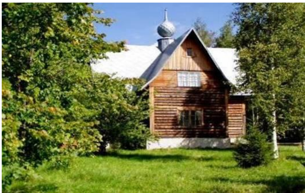
Крае ведче ский музей

есть типичного деревянного купеческого дома с магазином на 1-м этаже и жилой частью – на втором. Ул. Советская, 14